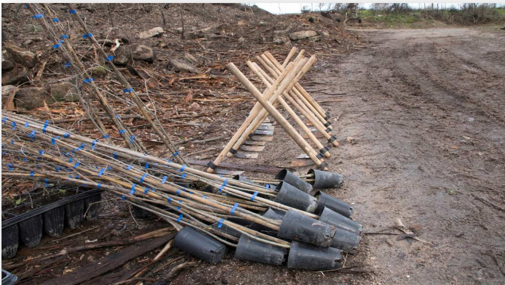
Árbores e ferramentas agardan aos voluntarios na xornada de plantación

Carballos, albedros, arces, teixos, estripeiros... ata un total de 400 árbores, de 11 especies diferentes, plantáronse por unha brigada de 20 voluntarios. Coca-Cola organizou a plantación e facilitou as plantas que se precisaban.