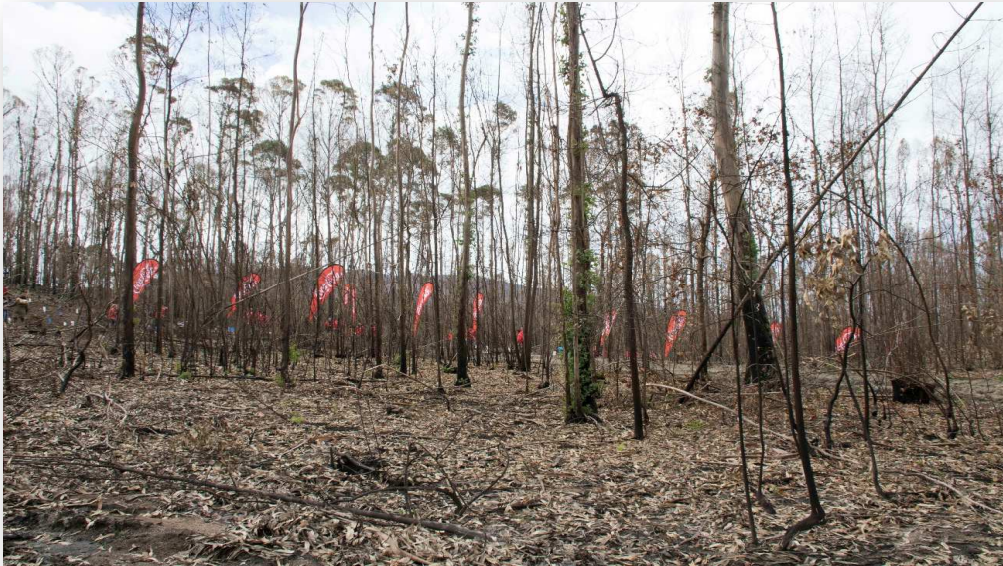
Viveiro da Moo