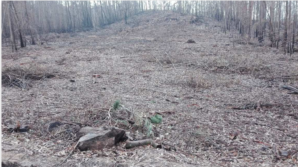
Finca do Viveiro da Moo antes da plantación.

Carballos, albedros, arces, teixos, estripeiros... ata un total de 400 árbores, de 11 especies diferentes, plantáronse por unha brigada de 20 voluntarios. Coca-Cola organizou a plantación e facilitou as plantas que se precisaban.